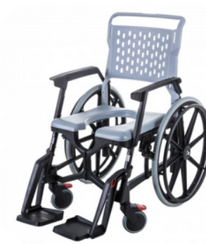
Fauteuil roulant de douche