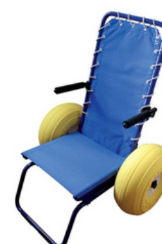
Fauteuil roulant pour baignade