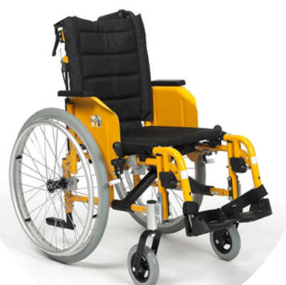
Fauteuil roulant enfant