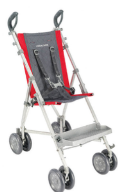
Poussette enfant handicapé