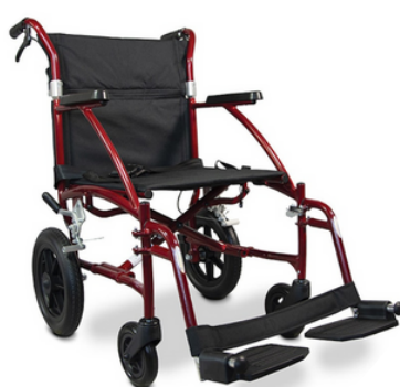
Fauteuil roulant de transfert